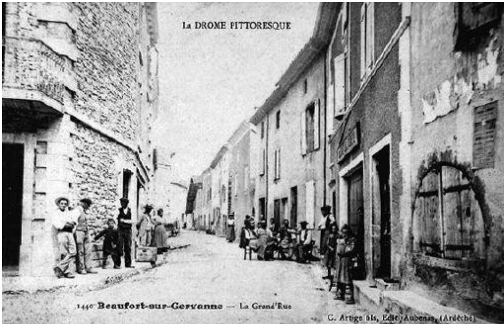
La DROME PITTORESQUE