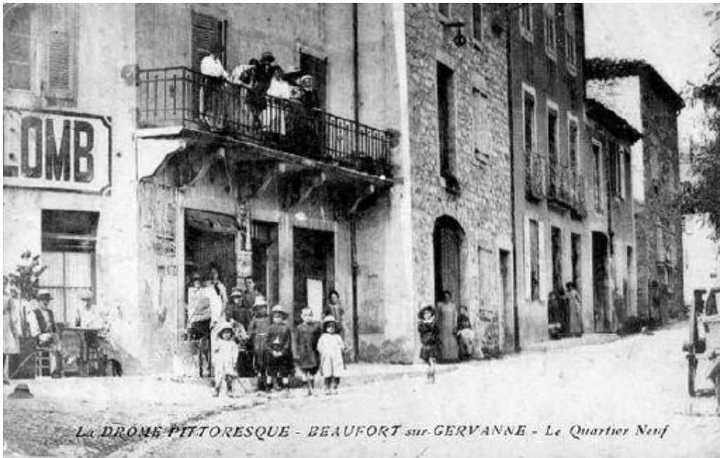
La DROME PITTORESQUE - BEAUFORT sur GERVANNE - Le Quartier Neuf